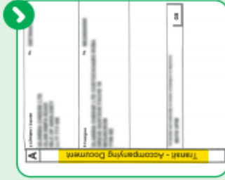
COMMON TRANSIT ACCOMPANYING DOCUMENT