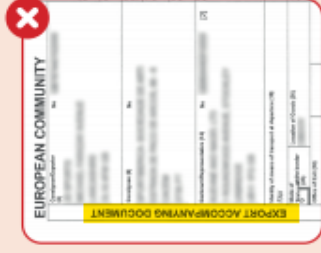
UK EXPORT DECLARATION